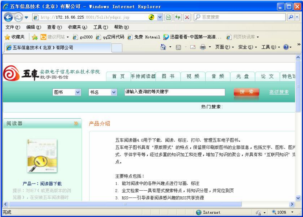
图三 阅读器下载网页