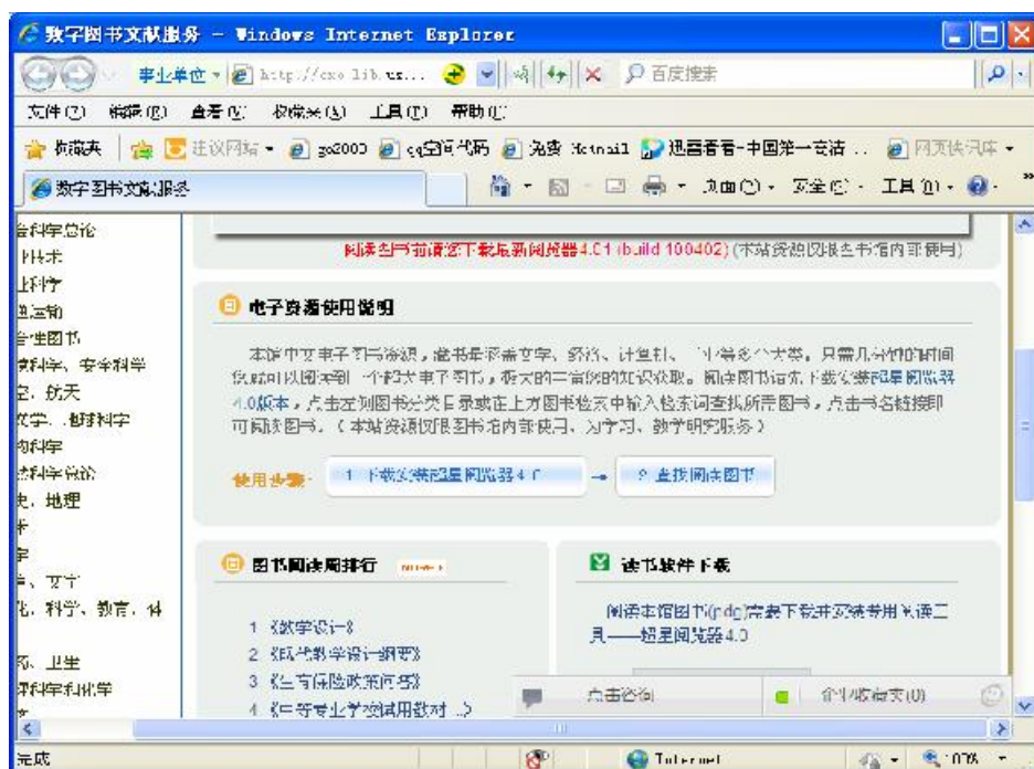
图五 超星中文数字图书首页（仔细阅读超星阅读器下载安装说明）