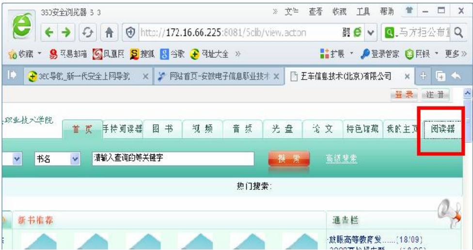
图二 五车数字图书馆首页

图二所示，点击“阅读器”标签进入阅读器下载网页（图三），而后就可以正常阅读图书了（注：使用时需先运行加载项，请关注五车网页上方的亮条）。阅读方式有“在线阅读”和“下载阅读”两个方式，若在线阅读人数较多，则可能会影响在线阅读的速度，此时建议下载到本地电脑里阅读。