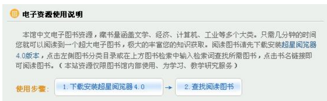
图六 超星使用说明